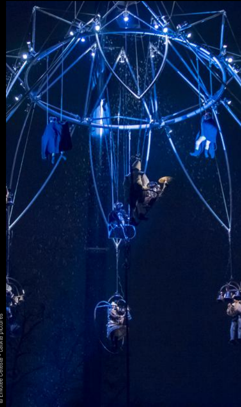
© Envolée Céleste - cathédrale de Metz

Attention, jauge limitée, dans la limite des places disponibles. Il est conseillé de venir dès 16h30.